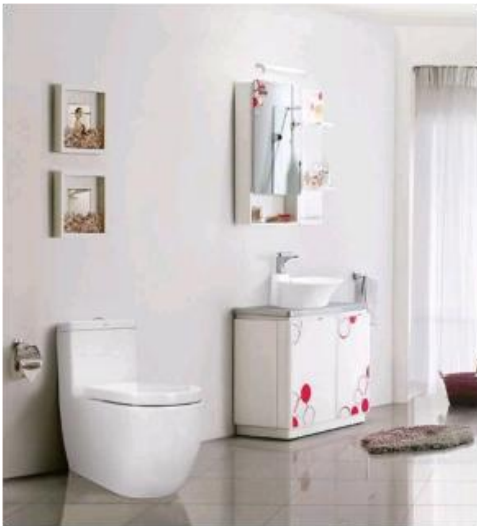
Ảnh: sản phẩm của Công ty

Công ty cổ phần Sứ Viglacera Thanh Trì tập trung sản xuất các sản phẩm sứ vệ sinh mang thương hiệu Viglacera. Hiện nay Công ty là một trong những đơn vị hàng đầu về sản xuất sứ vệ sinh ở Việt Nam nhờ việc không ngừng cải tiến, nâng cao chất lượng sản phẩm. Sản phẩm sứ vệ sinh của Công ty hiện nay đạt tiêu chuẩn chất lượng châu Âu. Các sản phẩm của Công ty được khách hàng trong nước ưa chuộng do chất lượng tốt và giá cả hợp lý, ngoài ra sản phẩm còn được xuất khẩu sang thị trường các nước như: Italia, Nhật Bản, CHLB Nga, Ucraina, Banglades, Iraq, ... Công ty đang là thành viên của Viện Nghiên cứu Gốm Sứ Anh (Cream Reseach).