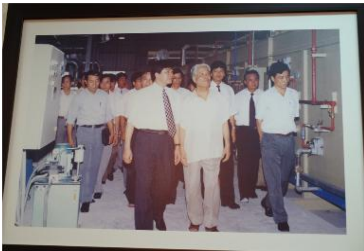
Ảnh: Đồng chí Đỗ Mười, nguyên Tổng Bí thư Ban chấp hành TW Đảng, về thăm và làm việc với Công ty

xưởng, máy móc, thiết bị, xưởng Gạch Thanh Trì đã nhanh chóng trở thành một đơn vị cung cấp gạch chịu lửa cấp thấp, gạch xây, gạch lát, ống sành có uy tín ở miền Bắc. Năm 1962, sản phẩm gạch khối tráng men của Sứ Thanh Trì đã vinh dự được sử dụng để trang trí cho công trình Hội trường Ba Đình – một công trình có yêu cầu chuẩn mực và tiêu biểu ngày ấy. Trên đà phát triển, đến tháng 7/1964, xưởng Gạch Thanh Trì đã được nâng cấp thành Xí nghiệp Gạch Thanh Trì, bộ máy tổ chức của xí nghiệp được hình thành, được củng cố và đi vào hoạt động khá hiệu quả. Xí nghiệp đã tiếp nhận nhiều đoàn thực tập sinh được đào tạo ở nước ngoài về, là lực lượng công nhân và cán bộ kỹ thuật nòng cốt để thực hiện các thay đổi về công nghệ, kỹ thuật cho sản xuất các mặt hàng cao cấp như gạch men kính, sứ vệ sinh sau này. Các sản phẩm chủ lực của Xí nghiệp giai đoạn này bao gồm ống sành tráng men muối, gạch chịu axit, gạch men. Công nghệ sản xuất sứ vệ sinh đã bắt đầu được nghiên cứu và sản xuất thử nghiệm nhưng sản lượng, chất lượng và tỷ lệ thu hồi chưa được cao.