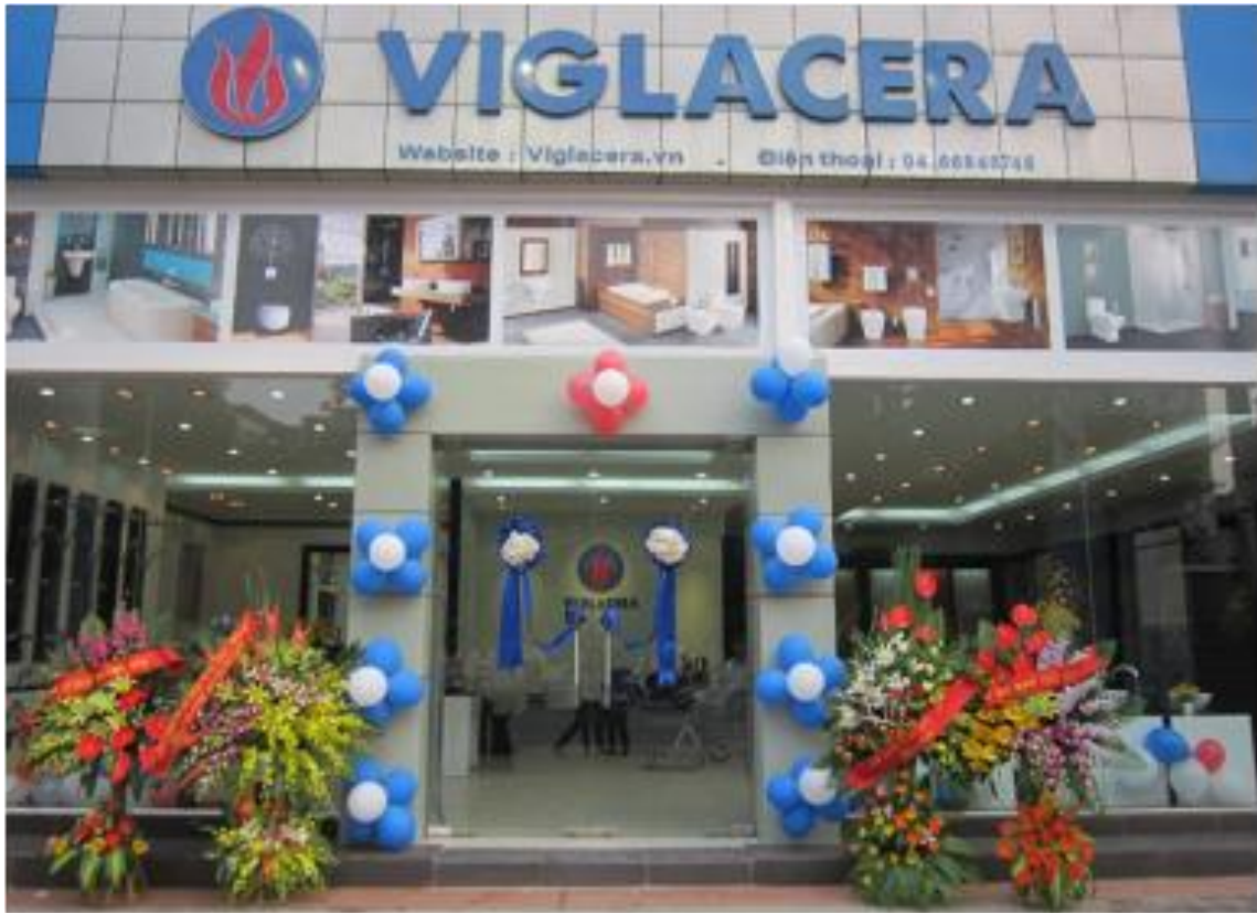
Ảnh: showroom của Viglacera bán sản phẩm của Công ty

thành Việt Nam phù hợp với mức thu nhập của đại đa số người dân, nay đã tiếp cận đến thị trường cao cấp có khả năng cạnh tranh mạnh mẽ với nhà sản xuất nước ngoài thông qua việc ứng dụng công nghệ Nano trên sứ của công ty DFI của Mỹ, áp dụng thiết kế kiểu dáng Châu Âu, đồng bộ hóa với sản phẩm sen vòi và phụ kiện vệ sinh.